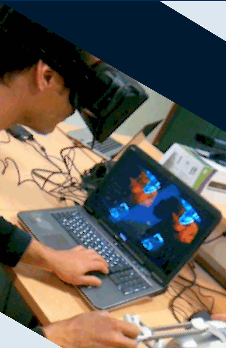
Image numérique & Jeux video - IMAGINA -

Faculté des Sciences Université de Montpellier Département Informatique Place Eugène Bataillon / Bât. 16 CC 12 34095 Montpellier Cedex 5