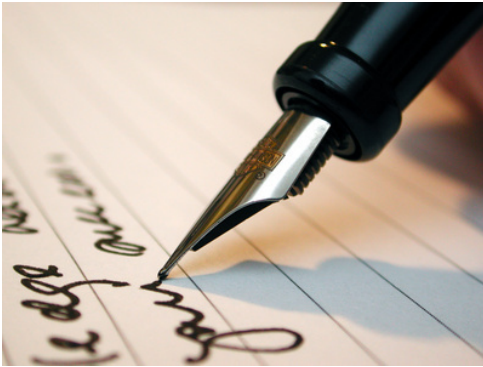
CV et lettre de motivation

Pour quels concours ces documents sont-ils exigés ?